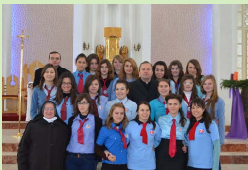
Acțiunea Catolică: o nouă adeziune